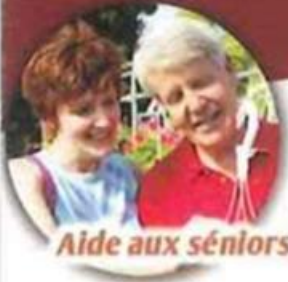
Aide aux séniors