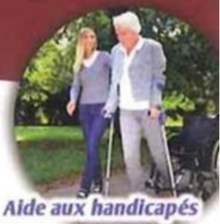
Aide aux handicapés