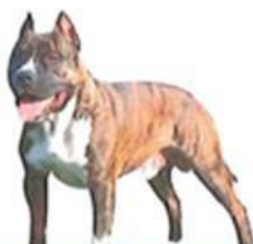
American Staffordshire terrier