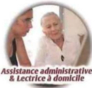
Assistance administrative & Lectrice à domicile

1 heure offerte ! sur votre 1er mois de prestation