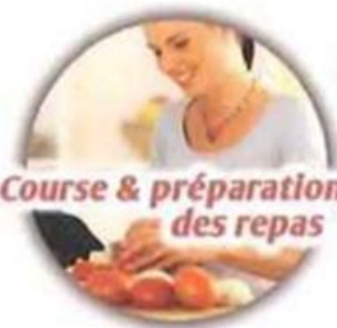
Course & préparation des repas